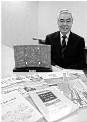
宇都宮賞レリーフと著者