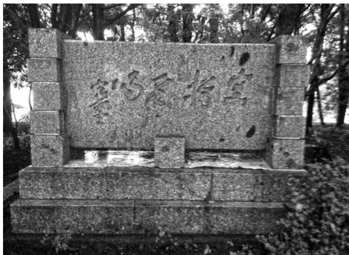
「空樽自鳴」碑 大分県中津市